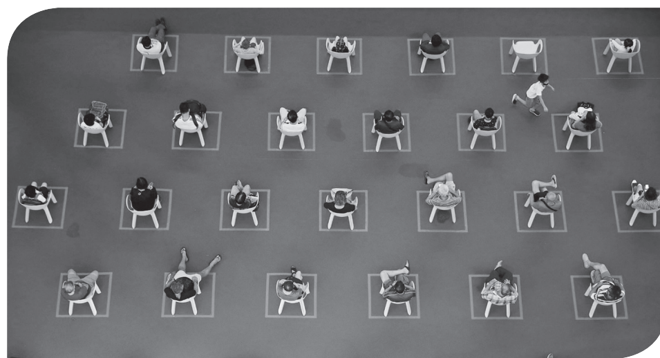
PEMUTARAN FILM LUAR RUANGAN

sebuah pernyataan. "Saat ini, kami memiliki 4 ton bahan dengan pengayaan 3,5 dan 4 persen dan menurut prediksi berdasarkan ratifikasi parlemen, kami akan meningkatkan kapasitas kami hampir menjadi 500 ton per bulan," ujarnya. "Ini berarti 6 ton per tahun dan kami dapat mengatakan bahwa dalam setahun kami akan memiliki hampir 10 ton uranium yang setara dengan kapasitas sebelum Rencana Aksi Komprehensif Bersama (JCPOA)," imbuh dia. ● tom